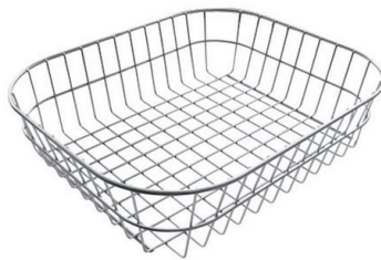
PANIER INOX POUR CUVE 34x40 CM