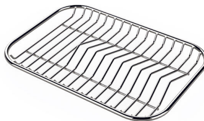
GRILLE PORTE-ASSIETTES INOX 25x35