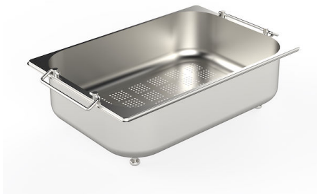
CUVETTE PERFOREE INOX