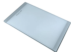
PLANCHE DE DECOUPE CRYSTAL 23x41 CM