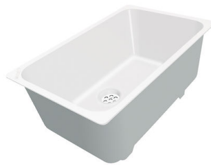
CUVETTE PLASTIQUE BLANCHE