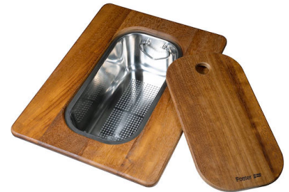
PLANCHE DE DECOUPE DOUBLE IROKO