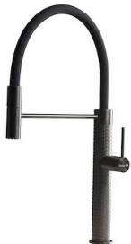
INCISO GUN METAL