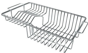
GRILLE PORTE-ASSIETTES INOX 250x425