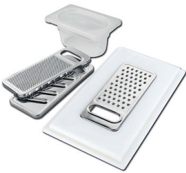
KIT RÂPES ET PLANCHE DE DECOUPE HDPE