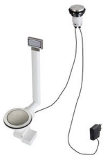
VIDAGE FADE LIGHT