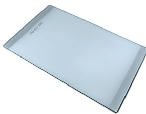
PLANCHE DE DECOUPE CRYSTAL 23x41 CM