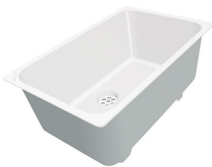
CUVETTE PLASTIQUE BLANCHE