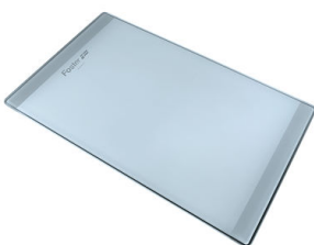
PLANCHE DE DECOUPE CRYSTAL 23x41 CM