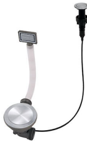
VIDAGE FADE PUSH INOX