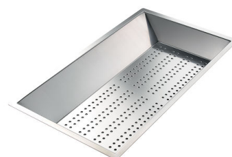
CUVETTE INOX PERFOREE