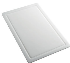
PLANCHE DE DECOUPE HDPE 27x42 CM