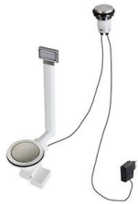
VIDAGE FADE LIGHT