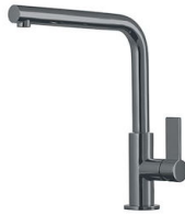
VERONA GUN METAL