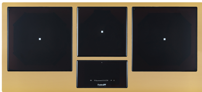
TABLE CUISSON INDUCTION GEMMA LIGNE INOX