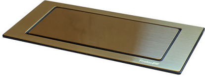
SUPPORT DE PRISE VERSO GOLD