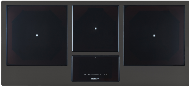
TABLE CUISSON INDUCTION GEMMA LIGNE INOX