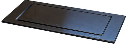
SUPPORT DE PRISE VERSO GUN METAL