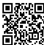
TABLE CUISSON INDUCTION PUNTO - NOIR 29x51 2 ZONES