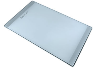
Planche de découpe en verre