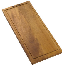
Planche de découpe en noyer