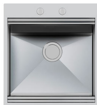
Évier Foster Milano