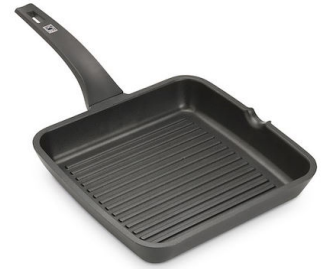
Grille de contact Induction PRO