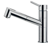
Mitigeur F2000 - Basso