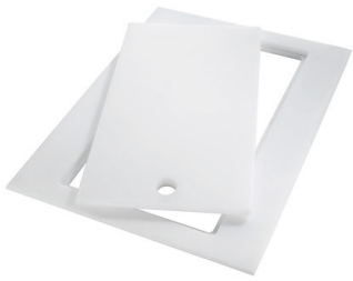
Planche de découpe Twin in HDPE