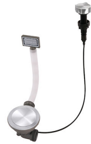
Vidange automatique Space Milano