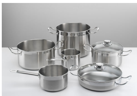
Série de pots induction PRO 8pcs.